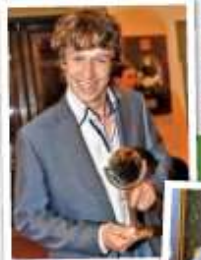
Děky roli Danu v seriálu Česky Belmonto získal v únoru 2012 svou objev roční 2012.

Původně jste ale citovělo školu na hony vzdálenou umění. Proč? Po zákeřnosti jsem nastoupil na strojírenskou průmyslovku, a to jsem pro, že na stejné škole šel můj nejlepší kamarád. Hlída, Švec a Kraus – byli jsme naručně trojka a já nacházel ikrát parou. Záhy jsem ale pochopil, že průmysl nebývá dobrá volba. Ta škola mě kouřilo nebavila a taky mi nešla. Přepočítal jsem jen tak-tak a trpěl. Po maturitě jsem se zapřemáhl, že se studium je naděrně konce.